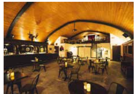
Eau Claire Distillery