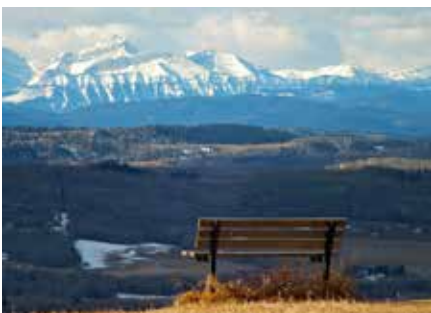
Vue du Leighton Art Centre