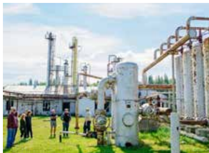
Usine à gaz de Turner Valley