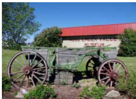
Nose Creek Valley Museum