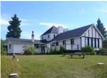
Leighton Art Centre