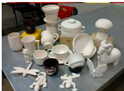
Fire Escape Studio

18h30 Rassemblement dans le hall d'entrée pour se rendre à la réception de bienvenue (5 minutes de marche) (navette disponible)