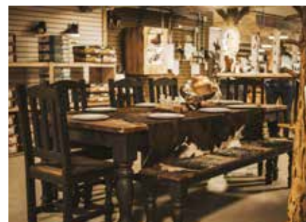
Irvine's Tack and Western Wear

Le magasin propose une variété de marques, dont Wrangler, Cinch, Ariat, Kimes, Weaver et Professional's Choice, et s'adresse à toute la famille. Il suffit de se promener et d'explorer toute la mode western, de la tête aux pieds. https://irvine-saddles.ca